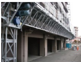
集合住宅大規模修繕工事