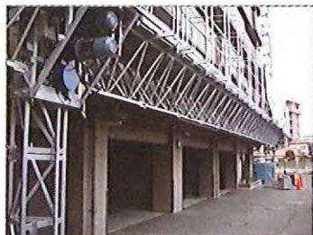
集合住宅大規模修繕工事